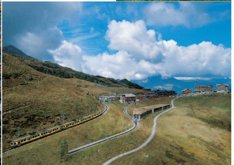
Im Hintergrund die Eigernordwand, rechts neben dem Geleise der Wanderweg