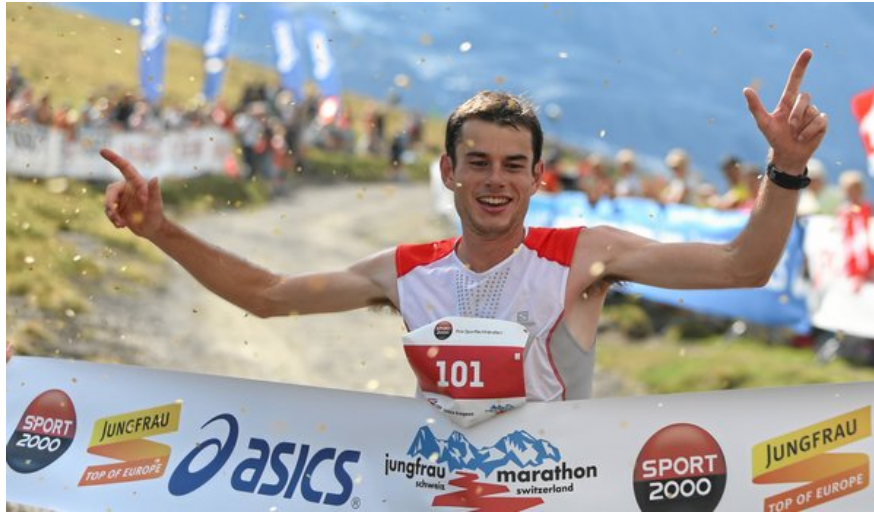
Sponsoren-Auftritt der Jungfraubahnen beim Jungfrau-Marathon