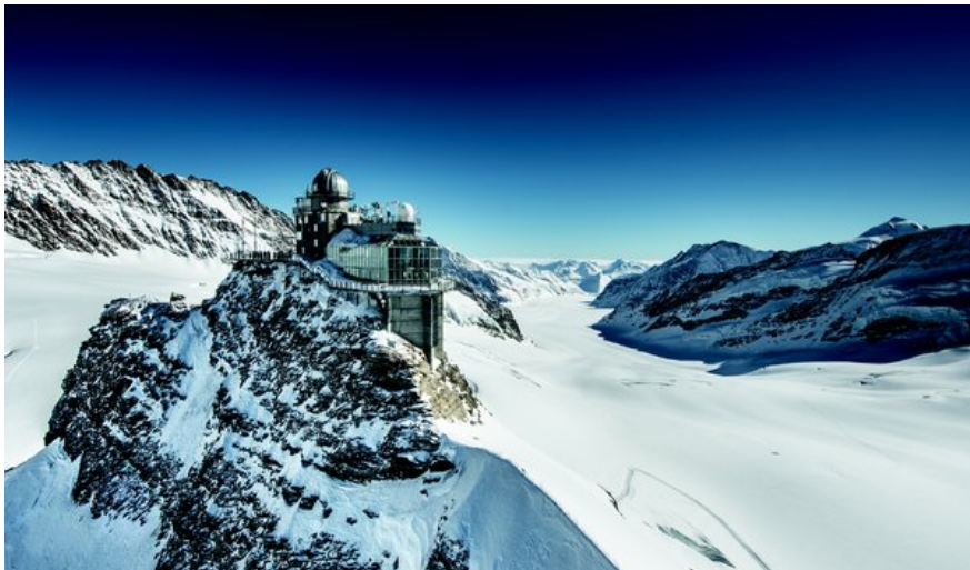
Sphinx und Aletschgletscher

Die Jungfraubahn-Gruppe ist ein führendes touristisches Unternehmen und das bedeutendste Bergbahnunternehmen der Schweiz. Das wichtigste Angebot ist die Reise zum Jungfraujoch – Top of Europe. Durch den langfristigen Aufbau eines Distributions- und Vertriebsnetzes kommt ihr eine Leaderstellung in den asiatischen Märkten zu. Die Jungfraubahn-Gruppe bietet zudem Ausflüge zu den bekannten Erlebnisbergen der Jungfrau Region und ein Wintersportangebot. Sie betreibt ferner ein eigenes Wasserkraftwerk, vermietet Räumlichkeiten für Restauration und betreibt sowie vermietet Shops.